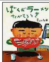
No.23「ぼくがラーメンたべてるとき」