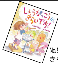
No.5「しょうがっこうが、きらいです！」