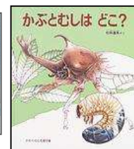
No.3 「かぶとむしはどこ？」 電子書籍はこちらから