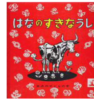
No.8「はなのすきなうし」