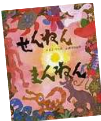
No.16「せんねんまんねん」