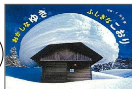
No.2「おかしなゆきふしぎなこおり」