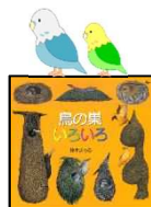
『鳥の巣いろいろ』 鈴木まもる/作 偕成社