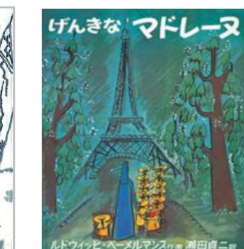
No.10「げんきなマドレーヌ」