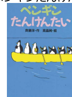
No.7「ペンギンたんけんたい」