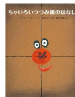
No.6「ちゃいろいつつみ紙のはなし」