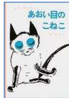
No.2「あおい目のこねこ」